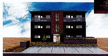
EXTERIOR & GARDEN PLAN